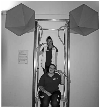
Diese Riesenohren verdeutlichen das Prinzip der Ohrmuscheln: Diese sammeln wie Trichter die Schallwellen und verstärken hierdurch das Signal. Hält man sich die Schläuche an die Ohren, kann man selbst leiseste Geräusche wahrnehmen.

Plasmakugel, Trabi-Heber, Riesenohren: Diese und andere Attraktionen kann man in der Phänomania Büsum bestaunen. Rund 230 Experimentierstationen auf 6.000 Quadratmetern machen physikalische Phänomene und die Welt der menschlichen Sinne erlebbar. Dabei gilt: Anfassen und Ausprobieren strengstens erlaubt. Erfahrene Guides sind dabei immer vor Ort, erklären