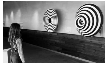
Spiel mit der optischen Täuschung: Rotierende Spiralen mit 3D-Effekt

Aus operativen Gründen wird die für den 20.04. im Watt'n Hus geplante Veranstaltung „Michael Eller – Gefährlich Ehrlich“ durch die TMS Büsum GmbH