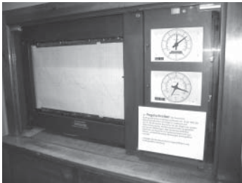
Ein Pegelschreiber aus den 60er Jahren – was es damit auf sich hat, erfahren Sie bei der heutigen Führung

Gerade, weil die Ausstellung während der Winterpause erweitert wurde, ist es besonders interessant, wenn ein fachkundiger Führer die einzelnen Exponate erklärt und Fragen sofort beantworten kann.