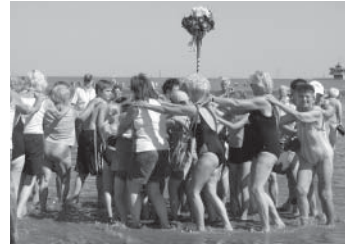
Auch für eine Polonaise taugt das Büsumer Watt ...

Heute 15:30 Uhr am Hauptstrand. Ist es kühler als 18 °C fallen, findet stattdessen ein Konzert im Gäste- und Veranstaltungszentrum statt.