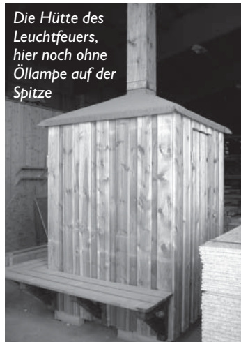
Die Hütte des Leuchtfuers, hier noch ohne Öllampe auf der Spitze

Am nächsten Wochenende soll der Turm aufgestellt und mit einer Feier am Samstag, den 30. Juni um 10:30 Uhr eingeweiht werden.