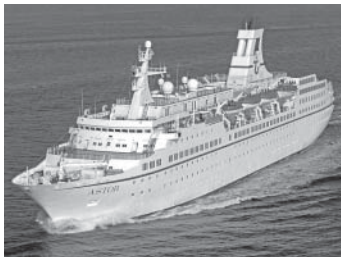
Samstag in Brunsbüttel: MS „Astor“

Ein lohnendes Ausflugsziel für Schiffsfans sind die Brunsbütteler Schleusen.