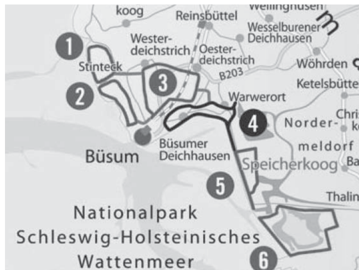
Kartenausschnitt mit den Laufstrecken in Büsum und im Speicherkoog. Die komplette Karte mit allen Strecken finden Sie ebenfalls im Info-Prospekt