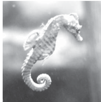
Eine kleine Sensation in der Nordsee: Seepferdchen „Henry“ ging im Juni bei einer Krabbenfangfahrt vor Büsum ins Netz

Sie finden das Aquarium am Parkplatz unter dem Piraten Meer. Geöffnet täglich von 11-17 Uhr