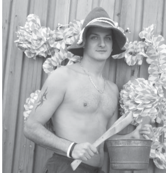
Die Saunameister warten mit deftigen Aufgüsse auf ihre Oktoberfest-Gäste