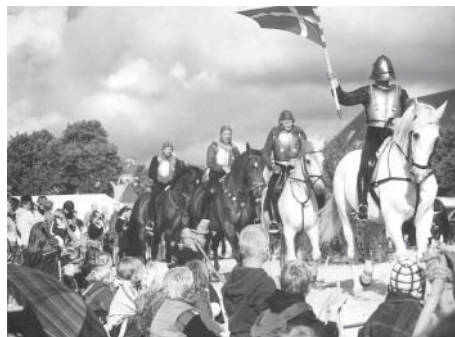
Szene des Freilichtspiels „Sag dem König Gute Nacht“

Einen Zeitsprung von gut 500 Jahren kann man an diesem Wochenende in Heide machen: Zum „Heider Marktfrieden“ verwandelt sich Deutschlands größter Marktplatz für vier Tage in ein mittelalterliches Dorf mit Händlern und Gauklern, Spielern und Handwerkern. Ein Freilichtspiel mit über 100 Akteuren kündigt davon, wie die