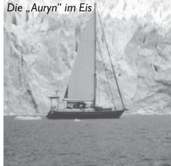
Die „Auryn“ im Eis

Die mitreißenden Erzählungen sind gespickt mit faszinierenden Fotos und Skizzen der einzelnen Törnabschnitte. Eintritt € 6,- mit gültiger Gästekarte (ohne Gästekarte € 8,-)