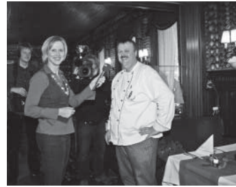
Das Fernseheteam bei Dreharbeiten in „Kolles Altem Muschelsaal“

Nordtour-Moderatorin Bärbel Fening begibt sich auf die Spuren der Büsumer Krabben: Zusammen mit den Mitarbeitern der Schutzstation Wattenmeer geht sie an einen Priel im Watt und lässt sich erklären, wie wichtig die Krabben für das ökologische Gleichgewicht im Nationalpark Wattenmeer sind. Aber auch die kulinarische Bedeutung der Krabben wird in der Sendung geklärt: Wie schmecken die Meeresfrüchte am besten, wie wird richtig gepulvt - dazu leckere Rezepte, die leicht nachzukochen sind.