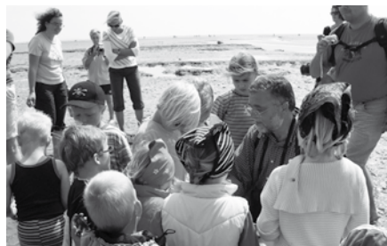
Das „Rohmaterial“ für ihre Bastelarbeiten finden die Kinder im Watt

Tierwelt sondern auch allerhand zum Basteln findet. Anschließend kehrt man in den Mini-Maxi-Club zurück um