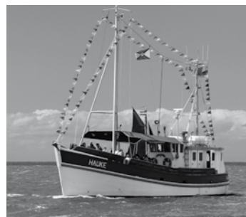
Büsums schwimmendes Standesamt: Der Kutter Hauke

Eintritt frei mit Gästekarte (ohne Gästekarte € 2,-)