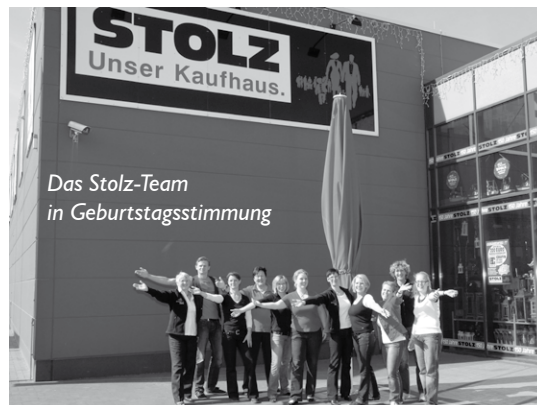
Das Stolz-Team in Geburtstagsstimmung

Auch am Ortseingang wird am Samstag groß gefeiert: Das Kaufhaus Stolz ist hier seit fünf Jahren für seine Kunden da. Das Vollsortiments-Kaufhaus wurde