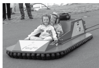
Zum Abheben: Die Luftkissenboote des THW

Als Dankeschön für die Kunden hat sich das Stolz-Team ein buntes Programm ausgedacht: Der Falkenhof Schalkholz lässt Raubvögel elegant über den Zuschauern kreisen und bietet ihnen die Möglichkeit, eines dieser Tiere selbst auf dem Arm zu tragen. Für rasante Action sorgen die Luftkissenboote