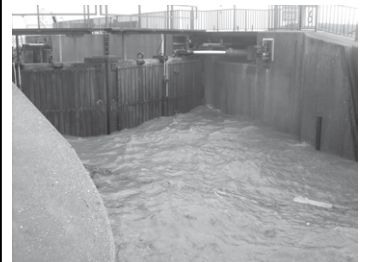
Der „Blanke Hans“ klopft ans Schleusentor

Wann wird ein Unglück zur Katastrophe, welche Arten von Katastrophen gibt es und wer schützt uns gegen Katastrophen? Die Antworten darauf und Interessantes über