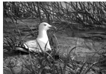
Eine Silbermöwe auf ihrem Gelege

Das Wattenmeer ist eines der letzten naturnahen Ökosysteme Mitteleuropas. Bilder aus Ver-