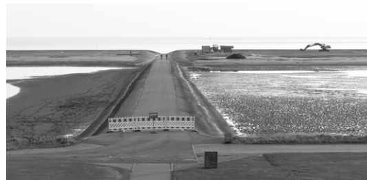
Vorher-Nachher: Was zu Baubeginn eher einer Mondlandschaft gleicht, wird in wenigen Monaten zum Badeparadies