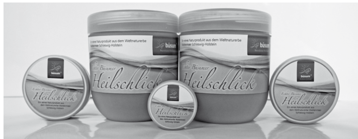
Saubere Sache: Büsumer Heilschlick als praktisches Pulver

Viele Büsum-Urlauber lassen sich während ihres Aufenthalts mit Nordseeschlick behandeln. Gerade bei Menschen mit Hauterkrankungen, Gelenksbeschwerden und Muskelverspannungen bringt dieses Naturprodukt oft Linderung. Aufgrund der positiven Wirkungen kam dabei oftmals der Wunsch auf, diese heilsame Substanz mit nach Hause nehmen zu können. Das Team vom Gesundheits- und Thalassozentrum Vitamaris hat