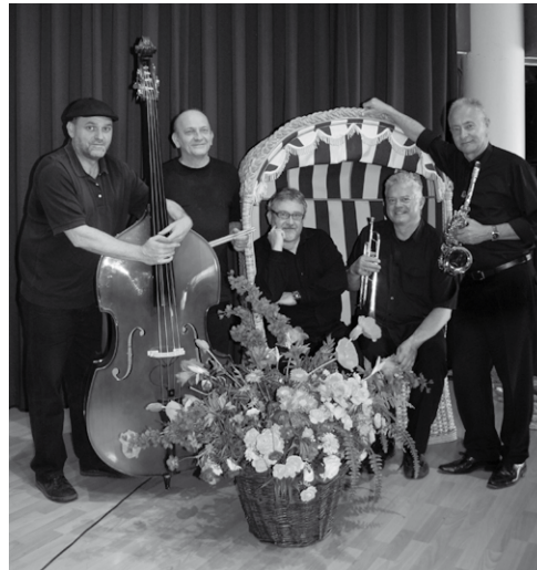
Hier noch in der 2011er-Besetzung: Das Kurorchester