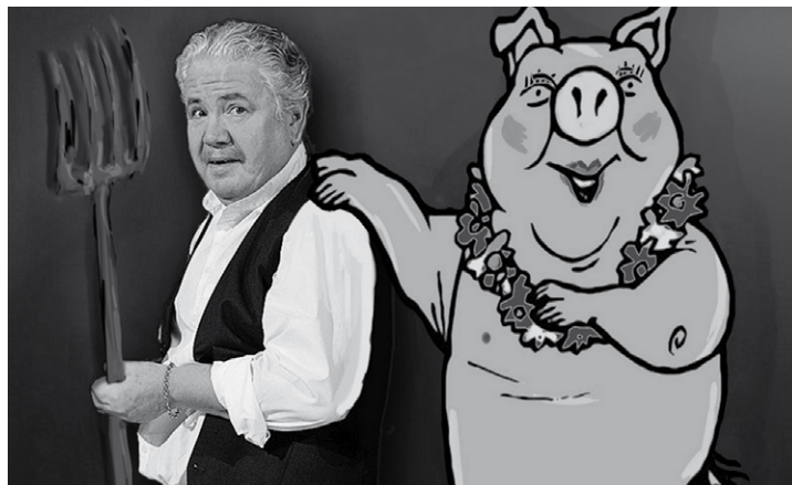
Am Montag ist das Millowitsch Theater aus Köln mit dem Stück „Bauer braucht Sau“ zu Gast im Büsumer Gäste- und Veranstaltungszentrum Seite 2