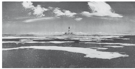
Westerhever Leuchtturm von Wolfgang Werkmeister

Die Farben, die Menschen, die Geschichte, die Naturgewalten und immer die Brandung des Meeres im Ohr – schon über Jahrhunderte haben sich viele Künstler, Musiker und Literaten an dieser einzigartigen Küste inspirieren lassen. Die Nordsee mit ihrem Charme und ihrer Ursprünglichkeit zieht die Menschen zu jeder Jahreszeit und bei jedem Wetter in ihren Bann. Wolfgang Werkmeister und Ole West zeigen in ihren Werken auf unterschiedliche Weise ergänzende Aspekte zur faszinierenden, auch bedrohlichen Naturgewalt der Nordsee, ihrer Landschaft und Bewohner. Die Galerie Tobien aus Husum zeigt eine Auswahl der beliebten und hochmeisterlichen Radierungen in einer Ausstellung in