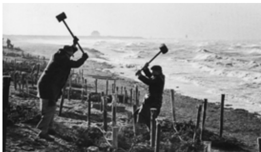
Vor dem nächsten Hochwasser muss der Deich provisorisch gesichert werden

Es hat nicht viel gefehlt in dieser Sturmnacht vom 16. auf den 17. Februar 1962 und die Geschichte Büsums wäre anders verlaufen: Die Gemeinde entging nur knapp einem verheerenden Deichbruch. Zum 50. Jahrestag der großen Flut soll in vielfältiger Weise an das Geschehen erinnert werden.