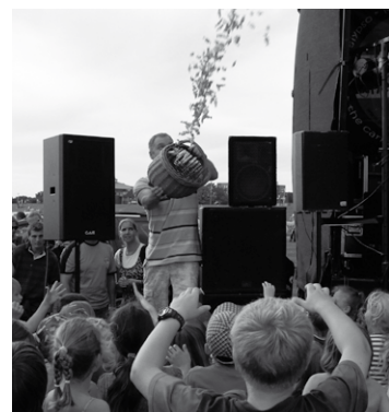
Darf nicht fehlen: Die Kinderdisco mit anschließendem Bonbon-Regen