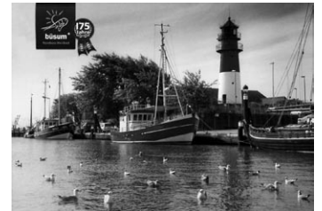
Diese Jubiläumspostkarte mit Sonderstempel erhält jeder Besucher mit Gästekarte gratis beim TMS

Die nächste Leerung des Sonderbriefkastens ist am Sonntag