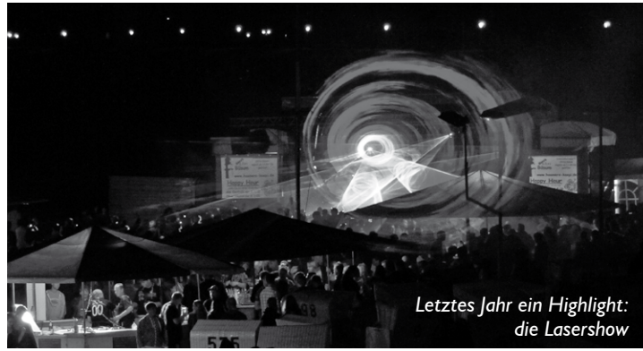
Letztes Jahr ein Highlight: die Lasershow

Weitere Informationen finden sich unter www.crazy-fete.de