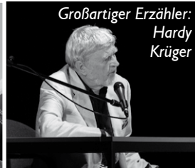
Großartiger Erzähler: Hardy Krüger