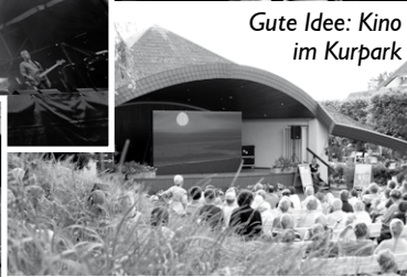
Gute Idee: Kino im Kurpark

Auch wenn wir sie hier nur in schwarz-weiß zeigen können – ein paar Impressionen der vergangenen Festwoche „175 Jahre Nordseebad Büsum“ wollen wir Ihnen nicht vorenthalten. Eine umfassende und reich bebilderte Rückschau auf das Geschehen finden Sie in der nächsten Ausgabe unseres Jahresheftes „Büsumer Bullauge“ (erscheint Anfang Dezember) www.buesumer-bullauge.de