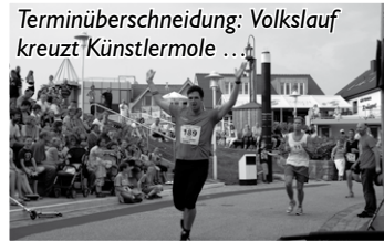
Terminüberschneidung: Volkslauf kreuzt Künstlermole ...