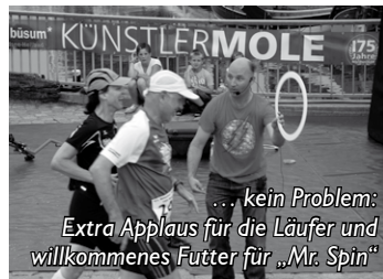
... kein Problem: Extra Applaus für die Läufer und willkommenes Futter für „Mr. Spin“