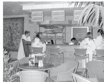
Wohltat nach dem Schwitzbad: Ein kühles Getränk an der Saunabar

Freitag., 21 Uhr, Piraten Meer (Einlass 20 Uhr) Eintritt € 12,- Info unter 04834/909133