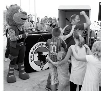
Für die richtige Bettschwere: Kinder-Polonaise mit „Crazy Ardo“

Der Eintritt ist frei Bei ungünstiger Witterung wird das Konzert ins Gäste- und Veranstaltungszentrum verlegt