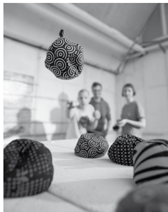
Beim Crossboule wirft man knautschige, schön gestylte Kugeln