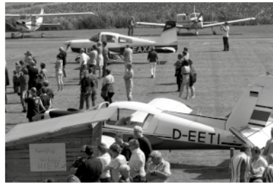
Einfach mal in die Luft gehen ...

Der Flugsportclub Heide-Büsum e.V. veranstaltet am Wochenende seine beliebten Familien-Rundflugtage auf dem Flugplatz in Oesterdeichstrich. Die Maschinen des Flugsportclubs stehen jedermann für kleines Geld für Rundflüge um Büsum zur Verfügung. Ebenso sind Rundflüge mit einem Helikopter möglich. Die Fallschirmspinger aus Kiel sind mit ihrem Sommerlager ab Samstag 14 Tage auf dem Platz und bieten Tandemsprünge für ganz Wagemutige an. Bei geeigneter Wetterlage ist am Samstagabend der Start eines