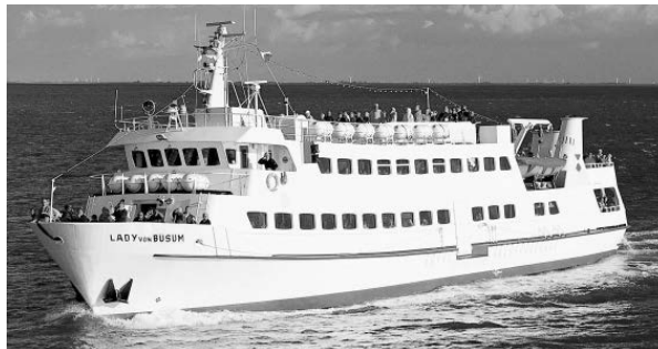
Das Flaggschiff der Reederei Rahder: die „Lady von Büsum“

Wer Büsum noch mal von der Seeseite aus erleben möchte, muss sich beeilen: Am 5. November endet der reguläre Fahrplan der Reederei Rahder für dieses Jahr. Bis dahin kann man noch an einstündigen Küstenfahrten, Krabben-Fangfahrten und den Törns zur Seehundsbank oder nach Helgoland teilnehmen. Am 1. November legt die Lady