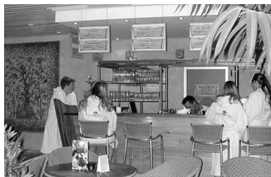
Wohltat nach dem Schwitzbad: Ein kühles Getränk an der Saunabar

Am 7. November lädt das Piraten Meer wieder ein zur „Langen Saunanacht“. An diesem Abend ist die Saunalandschaft bis 1 Uhr nachts geöffnet. Passend zum Motto „Eiszauber“ gibt es ein abwechslungsreiches Aufgussprogramm mit Überraschungen.