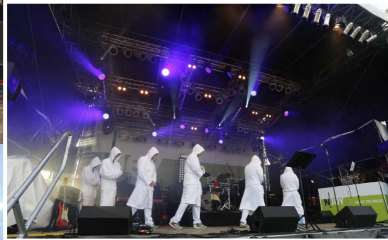
Kuhlage & Hardeland Morningshow Band