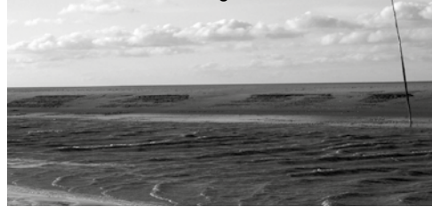
Einige Priele sind sogar schiffbar – Pricken weisen den Weg ...

in Begleitung erfahrener Wattführer tun.