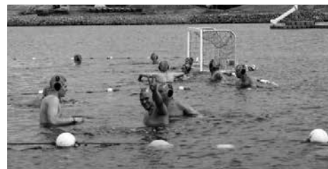
Die „Meldorf Seals“ richten dieses Jahr wieder ein Wasserball-Turnier aus

Die Familienlagune mit ihren beiden gezeitenunabhängigen Becken ist das ideale Revier, um seine Wassersportbegehung auszuprobieren. Gratis in verschiedene Wassersportarten reinschnuppern kann am Sonntag ab 10:30 Uhr. Zu diesem Zeitpunkt treffen sich die Wasserballer zur Vorbesprechung, bevor um 11 Uhr das von den „Meldorf Seals“ ausgerichtete Turnier beginnt.