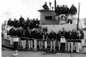
Die Ellunder Nordlichter auf dem Museumsschiff Rickmer Bock

Darüber hinaus gibt es ein buntes Rahmenprogramm mit Speis' und Trank, Hafenmarkt auf dem Ankerplatz und Museumshafen-Infostand.