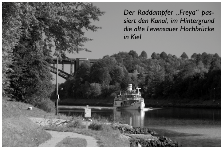
Der Raddampfer „Freya“ passiert den Kanal, im Hintergrund die alte Levensauer Hochbrücke in Kiel

120 Jahre wird er 2015 alt, der 1895 als Kaiser-Wilhelm-Kanal eröffnete heutige Nord-Ostsee-Kanal mit der internationalen Bezeichnung Kiel-Canal. Die Fahrt führt von Kiel über Holtenau quer durch Schleswig Holstein und zeigt nicht nur die Wasserstraße, sondern auch die umgebende Landschaft mit markanten Orten und Sehenswürdigkeiten.