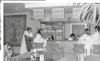
Auf die Besucher warten verschiedene Saunen sowie Dachgarten und Saunabar zum Abkühlen

Fr., 21 Uhr, Piraten Meer (Einlass ab 20 Uhr), Eintritt inkl. Begrüßungsgetränk € 15,- Info unter 04834/909133