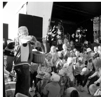
Bei der Kinderdisco lässt DJ Crazy Ardo auch mal Bonbons regnen ...

Der Eintritt ist frei Entfällt bei schlechten Wetter