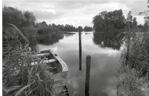
Die Eider bei Steinschleuse