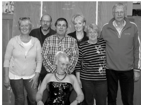
Das Ensemble der Büsumer Theotermoker freut sich auf die Premiere

Am Donnerstag um 20 Uhr hebt sich im Gäste- und Veranstaltungszentrum zum ersten Mal der Vorhang zu „Dree Engel für Helmfried“, dem neuen Stück der Büsumer Theotermoker.