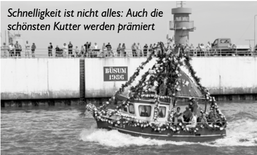
Schnelligkeit ist nicht alles: Auch die schönsten Kutter werden prämiert

Das kommende Wochenende steht ganz im Zeichen von Büsums größtem Saisonspektakel: Die Kutterregatta macht den Hafen für drei Tage zur Partymeile. Als Höhepunkt der Veranstaltung wird nicht nur der schnellste Kutter ermittelt, sondern auch der schönste. Wer es wird, liegt mit etwas Glück in Ihren Händen: Wir suchen 6 Urlauber als Jury-Mitglieder, die über den schönsten Kutter dieser Regatta befinden. Alles was Sie brauchen, sind ein paar