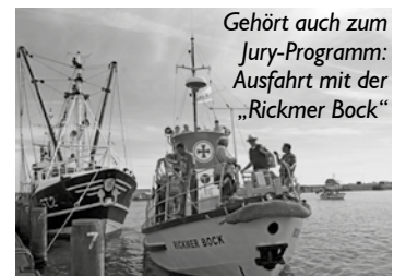
Gehört auch zum Jury-Programm: Ausfahrt mit der „Rickmer Bock“

Wer dabei sein möchte oder noch Fragen hat, melde sich Montag oder Dienstag zwischen 10 und 12 Uhr in unserer Redaktion (Tel. 04834/960484)