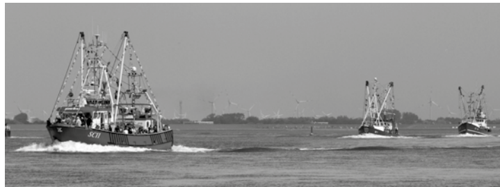
Alles fährt um die Wette: Kutter, Börteboote, Papierboote (o. Abb.) und SUPs