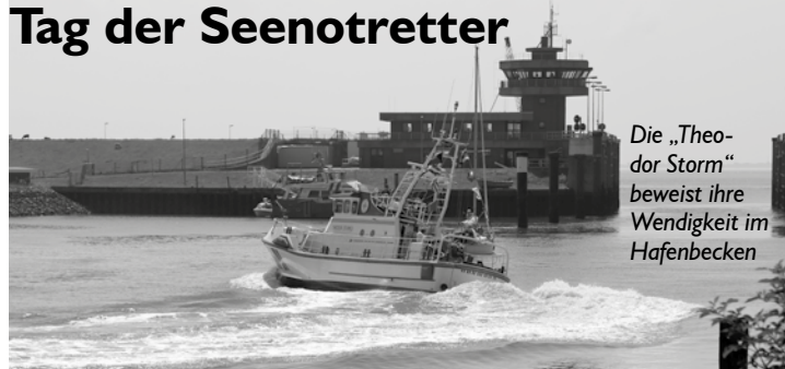
Die „Theodor Storm“ beweist ihre Wendigkeit im Hafenbecken

Immer am letzten Sonntag im Juli ist „Tag der Seenotretter“. Ab 11 Uhr informiert die Deutsche Gesellschaft zur Rettung Schiffbrüchiger am Ankerplatz über ihre Arbeit.