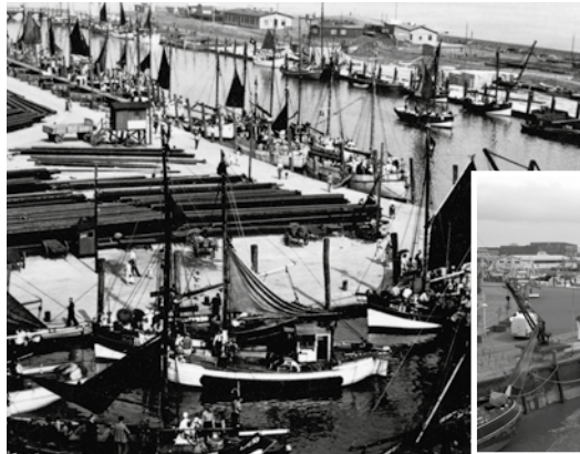
Bildpaare wie dieses zeigen die Veränderung des Ortes

Jeden Mittwoch laden die Büsumer Gästelotsen zu interessanten Vortragsveranstaltungen ein. In dieser Woche lautet das Motto: „Büsum im Wandel der Zeit“. Anhand von Bildern des alten und neuen Büsum gewinnen die Zuschauer einen Eindruck von der Veränderung