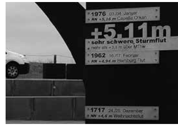
Eine Tafel an der Familienlagune erinnert an die Katastrophe vor 300 Jahren

Einen neuen Vortrag präsentieren die Gästelotsen am Mittwoch: Vor dreihundert Jahren überschwemmte eine Sturmflut in der Nacht vom 24. auf den 25. Dezember 1717 weite Bereiche entlang der Nordseeküste. Vom südlichen Dänemark bis zu den nördlichen Niederlanden ertranken Menschen und Vieh, wurden Häuser zerstört, manche Orte so in Mitleidenschaft gezogen, dass sie aufgegeben wurden. Bereits Ende Februar 1718 vergrößerte eine weitere Sturmflut die ohnehin schon schweren Schäden. Der Vortrag erinnert an diese Ereignisse im Licht der Verhältnisse jener Zeit. Dabei wird,