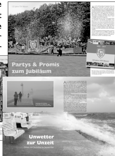
Partys & Promis zum Jubiläum