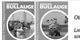
Oben: ein kleiner Blick ins neue Heft