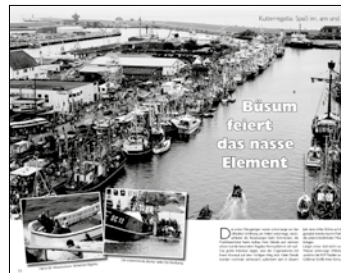
Büsum feiert das nasse Element

Unser farbiges Jahresheft „Büsumer Bullauge“ bietet nicht nur eine Rückschau auf das vergangene Jahr, sondern auch interessante Bilderberichte und Einblicke in die Büsumer Geschichte. Seit Anfang Dezember ist die 8. Ausgabe im Handel, unter anderem mit Bildern von der