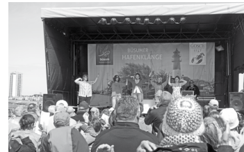
Pfingstmontag: Open-Air Gottesdienst

Das komplette Bühnenprogramm finden Sie auf Seite 2