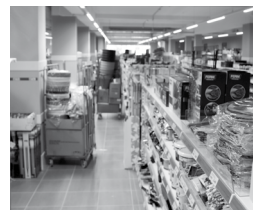
Letzte Arbeiten vor der Eröffnung: Die angelieferte Ware muss in die Regale

Lange standen die Geschäftsräume am Bahnhof leer – jetzt kehrt wieder Leben ein in den ehemaligen Sky-Markt: Der Non-Food-Discounter „Action“ eröffnet dort am Samstag um 9 Uhr seine neueste Filiale. Auf knapp 800 m 2 Verkaufsfläche werden insgesamt 14 Produktkategorien, wie Sport, Haushalt, Körperpflege, Do-it-Yourself, Deko oder Spielzeug & Unterhaltung angeboten.