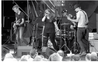
Ob Pay Pandora oder die Büsumer Reetdänzer – für jeden Geschmack ist etwas dabei