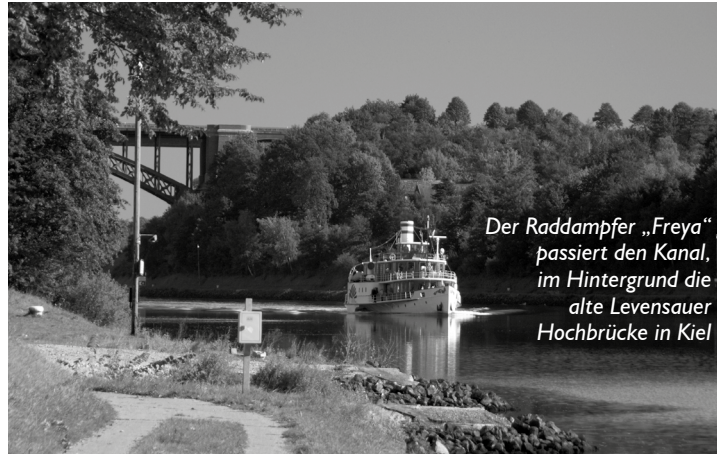
Der Raddampfer „Freya“ passiert den Kanal, im Hintergrund die alte Levensauer Hochbrücke in Kiel

An diesem Sonntag hat er seinen 125. Geburtstag: der 1895 als Kaiser-Wilhelm-Kanal eröffnete heutige Nord-Ostsee-Kanal mit der internationalen Bezeichnung Kiel-Canal. Die Fahrt führt von Kiel über Holtenau quer durch Schleswig-Holstein und zeigt nicht nur die Wasserstraße, sondern auch die umgebende Landschaft mit markanten Orten