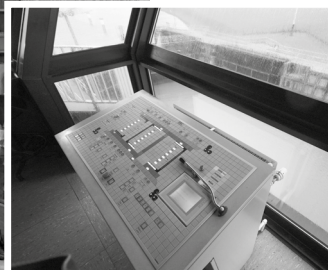
Links: Halle der Büsumer Kleinbahn Oben: Bedienpult des Sperrwerks

Das schwer oder gar nicht Zugängliche übt fast immer einen Reiz der Neugier aus und beflügelt die Phantasie. Wie mag es wohl dort aussehen? Was geschieht dort? Was lagert dort? Darf ich vielleicht doch einmal hinein?