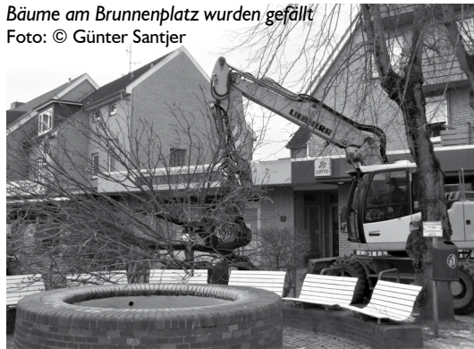
Bäume am Brunnenplatz wurden gefällt