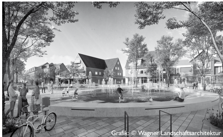
Grafik: © Wagner Landschaftsarchitektur

Wer in diesen Tagen an den Brunnenplatz kommt, dem bietet sich ein ungewohnter Anblick: Anfang Februar wurden über 40 Bäume auf dem Platz gefällt. So kahl wird es dort allerdings nicht lange bleiben: Ab September wird der Brunnenplatz sowie der obere Teil der Alleestraße ganz neu gestaltet: mit Pflanz- und Rasenflächen, Spielgeräten, Sitzgelegenheiten