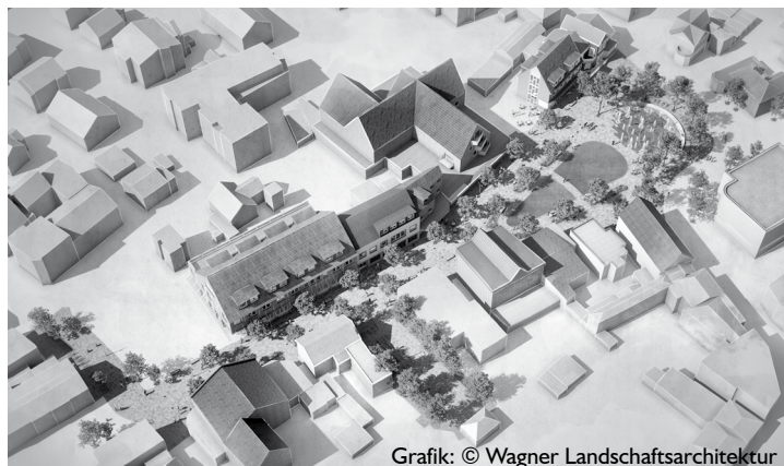
Grafik: © Wagner Landschaftsarchitektur

einem Wasserfontänenfeld und natürlich mit neu gepflanzten Bäumen. Die alten und zum Teil kranken Bäume mussten jetzt schon weichen, da Fällarbeiten nur bis zum 1. März erlaubt sind. Die beiden Grafiken geben einen kleinen Vorgeschmack auf die künftige Gestaltung dieses Bereichs, der bereits 2019 zur Fußgängerzone umgewidmet wurde.