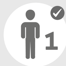
Alleine einkaufen, ein-/auschecken

Auf diese Einschränkungen werden Sie sich einstellen müssen: In Hotels, Restaurants, Geschäften und bei Veranstaltungen gibt es Maßnahmen zur Einhaltung von Mindestabständen und der Regulierung der Gästezahl.