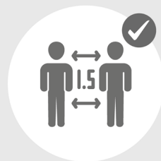
Mindestabstand 1.5 Meter