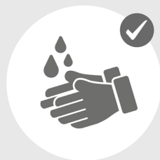
Mind. 20 Sekunden Hände waschen

Daher ist Urlaub in Büsum jetzt nur mit verantwortungsbewusstem Handeln und mit Einschränkungen möglich.