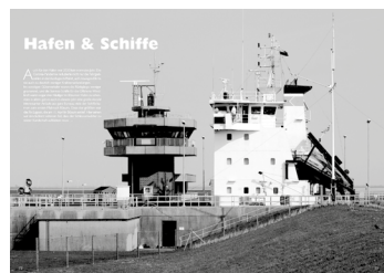
Ein kleiner Blick ins neue Heft

Ausgabe 2020, 92 Seiten ISBN 978-3-9815580-1-2, € 8,- Erhältlich im örtlichen Buch- und Zeitschriftenhandel www.buesumer-bullauge.de