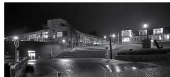
In normalen Silvesternächten drängen sich hier an der Freitreppe Tausende

darauf hin, dass viele Leute zu Hause oder in der Ferienwohnung gefeiert haben. Die pyrotechnischen Aktivitäten waren wegen des Verkaufsverbots nur gering, aber einige Restbestände wurden um Mitternacht herum doch noch verfeuert. Auch Polizei und Ordnungsamt sprachen von einer sehr ruhigen Silvesternacht.