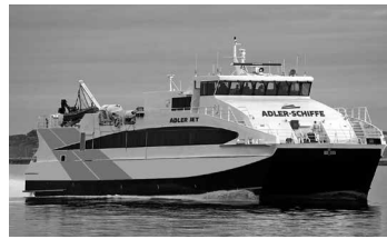
In zwei Stunden von Büsum nach Amrum: der HighspeedKatamaran „Adler Jet“ macht's möglich

Erstmals ist in diesem Jahr der Katamaran „Adler Jet“ von Büsum nach Amrum im Einsatz. Am 13. Oktober findet nun die letzten Fahrt dieser Saison statt – morgens hin, abends zurück, die Fahrzeit beträgt nur zwei